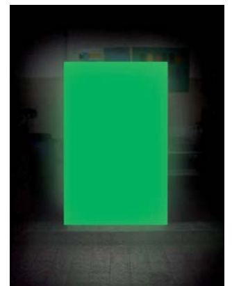
nachleuchtend im Dunkeln